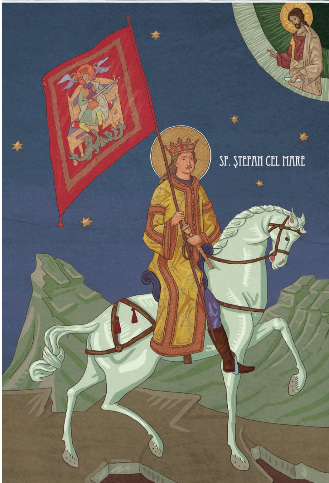
ȘT. ȘTEFAN CEL MARE