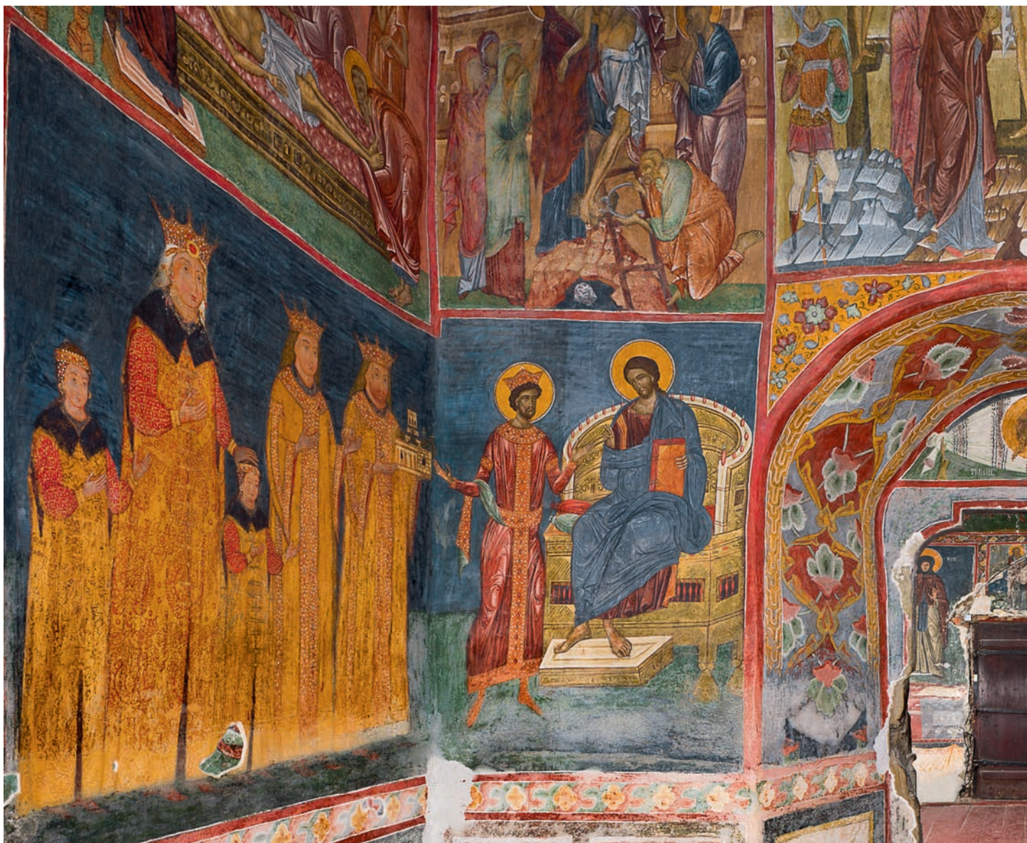
Naos, Biserica Mănăstirii Pătrăuți. The Naos, The Church of Pătrăuți Monastery.