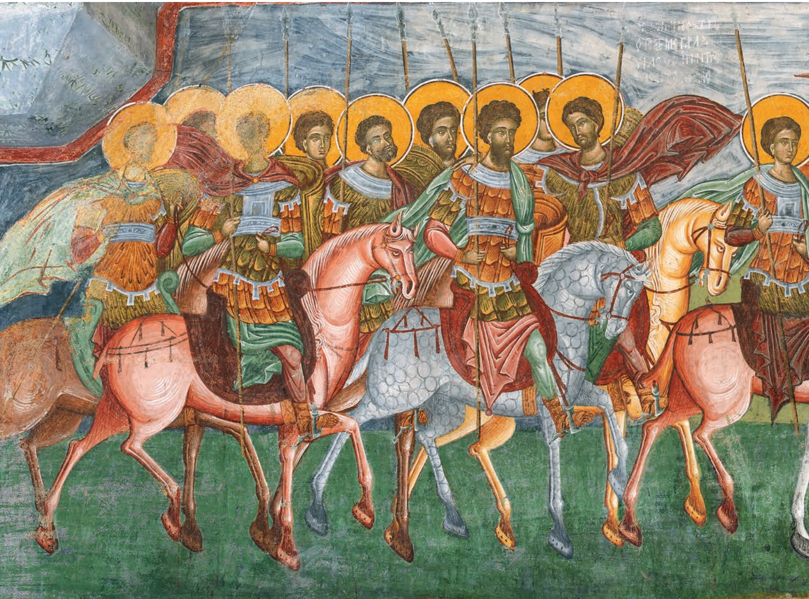
Cavalcada Sfintei Cruci, Biserica Mănăstirii Pătrăuți. Cavalcade of the Holy Cross, The Church of Pătrăuți Monastery.