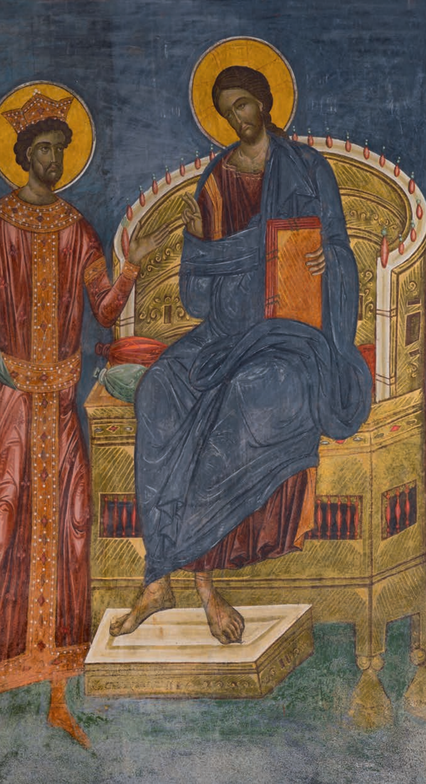
Tabloul Votiv, Biserica Mănăstirii Pătrăuți.

The Votive Picture, The Church of Pătrăuți Monastery.